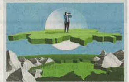
ILLUSTRATION AUREL MAERKI

Diesen Sommer baut die NZZ zusammen mit ihren Lesern gedanklich die Schweiz von morgen. Was will unser Land von seiner Zukunft, was von seiner Vergangenheit? Machen Sie mit.