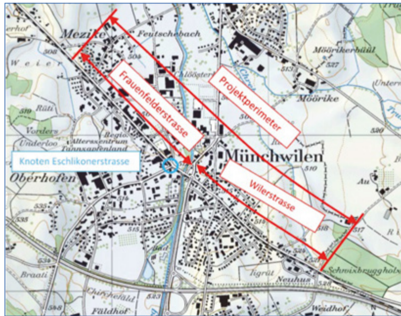
Projektperimeter «Betriebs- und Gestaltungskonzept Ortsdurchfahrt Münchwilen».

Unter der Federführung des kantonalen Tiefbauamtes Thurgau hat eine Planungsgruppe mit Ingenieuren, Landschaftsplanern, Planern des kantonalen Tiefbauamtes, Mitgliedern der Gemeindebehörde Münchwilen sowie Vertretern der Politischen Parteien von Münchwilen ein Vorprojekt erarbeitet. Die Arbeitsgruppe hat verschiedene Varianten entwickelt. Diese